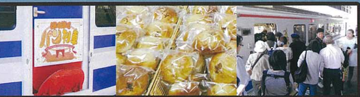
パン列車、もの巡る市、マルシェ、コーヒーマニア、げんき市に古本市と盛り沢山!