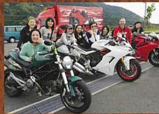
縄文ピースライダーズ