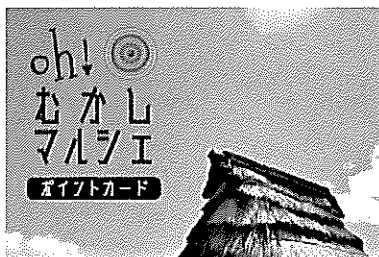
※イメージ画像です。