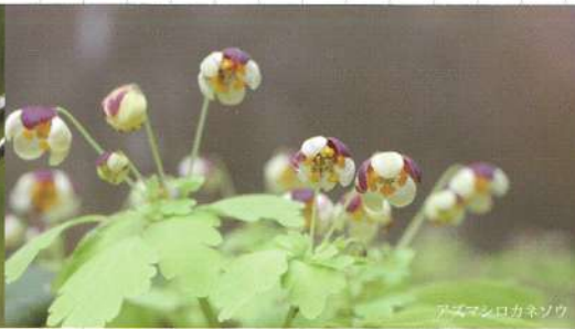
アズマシロカネソウ