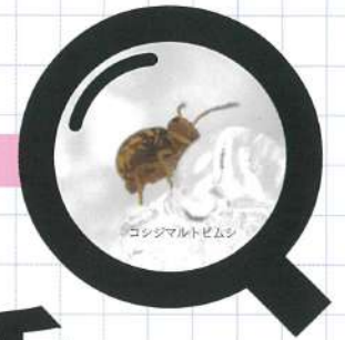
コシジマルトビムシ