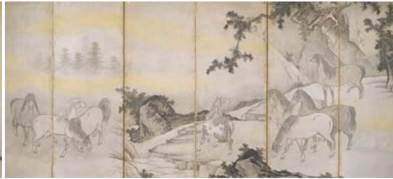
市指定文化財「群馬図屏風」雲谷等 筆