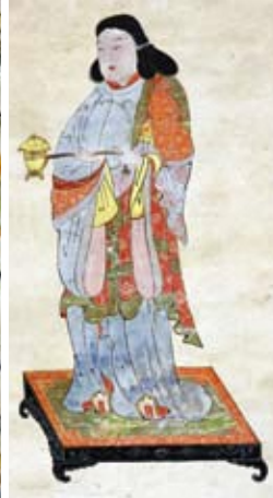
聖徳太子孝養像図