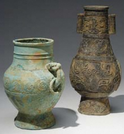
県指定文化財「伊達八幡館跡 銅製仏具」