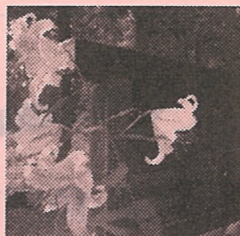
百合の見頃は6月です